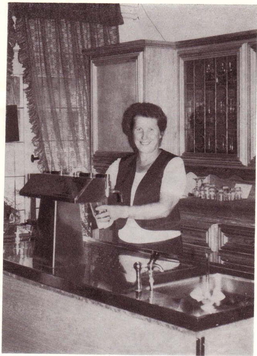
Durch das VEG (T) Groß Miltzow gebaute Gaststätte in Helpt, eröffnet 1983 aus Anlaß des 3. Kultur- und Sportfestes der Werktätigen der sozialistischen Landwirtschaft des Bezirkes Neubrandenburg