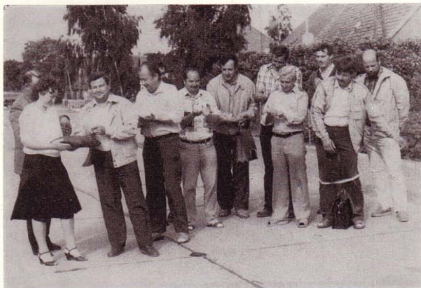
Übergabe der neugebauten Dorfstraße in Trebenow

Seit 1984 werden Straßen und Ortslagen in Badresch, Bandelow, Blumenhagen, Golm, Groß Miltzow, Groß Spiegelberg, Helpt, Klein Luckow, Lemmersdorf, Mildenitz, Pasenow, Rosenthal, Trebenow, Werbelow, Wiltsickow, Voigtsdorf und in der Kreisstadt rekonstruiert. 1986 wurde der Haltepunkt der Deutschen Reichsbahn in Groß Daberkow übergeben.