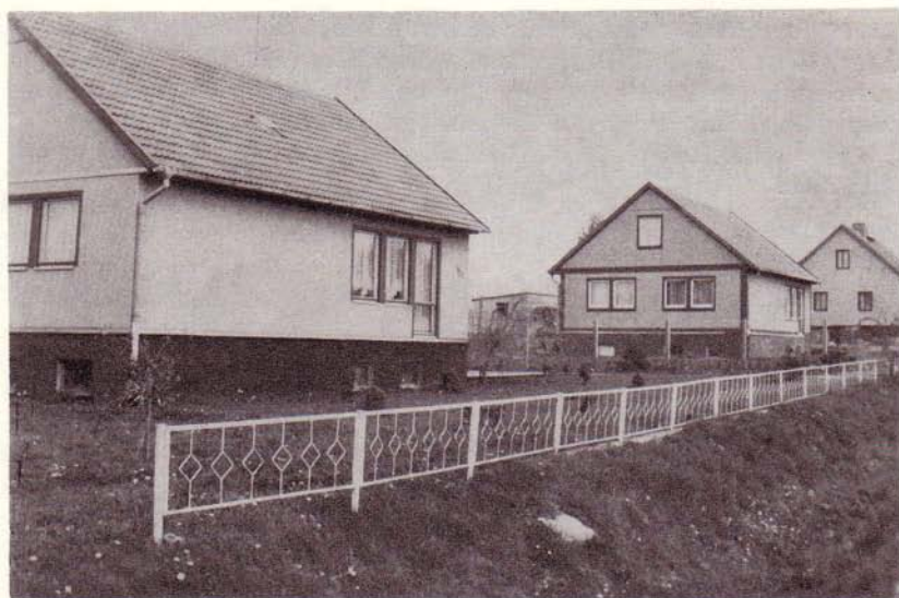
Eigenheime in Mildnitz