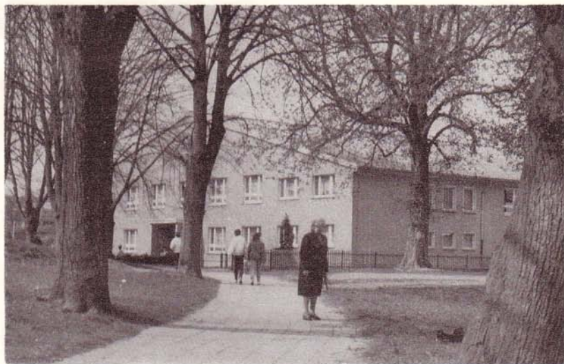
Otto-Naumann-Halle in Strasburg, 1978 eingeweiht

Rund 26 % unserer Bevölkerung sind im DTSB organisiert. Sie sind in 28 Sportgemeinschaften, 91 Sektionen und 30 allgemeinen Sportgruppen tätig. Dazu kommen 20 Orts- und 19 Betriebsgruppen des Deutschen Anglerverbandes der DDR mit 1 681 Mitgliedern, 1 Motorsportklub im Allgemeinen Deutschen Motorsportverband mit ca. 130 Mitgliedern und eine Sportgemeinschaft der SV Dynamo mit ca. 300 Mitgliedern. Es bestehen 3 Trainingszentren für Volleyball, Leichtathletik und Kanu.