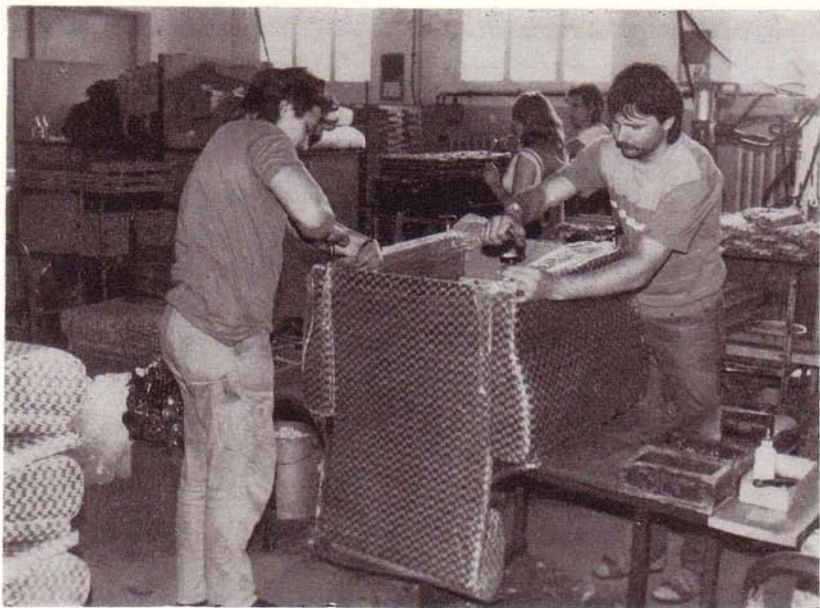
172 Werk­tätige im VEB Sitz- und Polstermöbel Hammer, Werk II Blumenhagen, erzeugten einen Wert von 42,1 Mio. Mark.

Die 123 Werk­tätigen des VEB Sirokko-Gerätewerkes Neubrandenburg, BT Woldegk , gehören zum Kombinat Fortschritt Landmaschinen und erzeugten eine industrielle Warenproduktion in Höhe von 15,3 Mio. Mark.