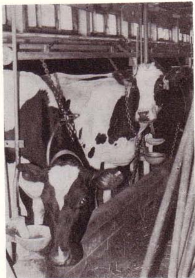
In der Milchviehanlage Neuensund