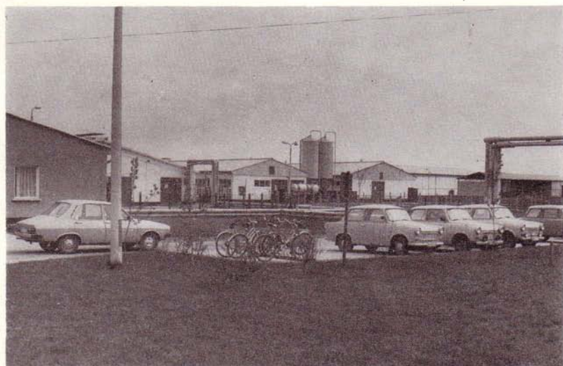
Teilansicht der rekonstruierten Milchviehanlage Neuensund des VEG (T) Strasburg. 1987 in Betrieb genommen.