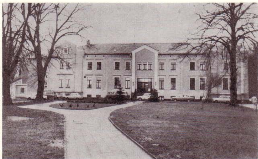
Kreispflegeheim Mildenitz nach der Rekonstruktion 1988

Der Einzelhandelsumsatz vervierfachte sich von 40,2 Mio. Mark 1955 auf 160 Mio. Mark 1988.