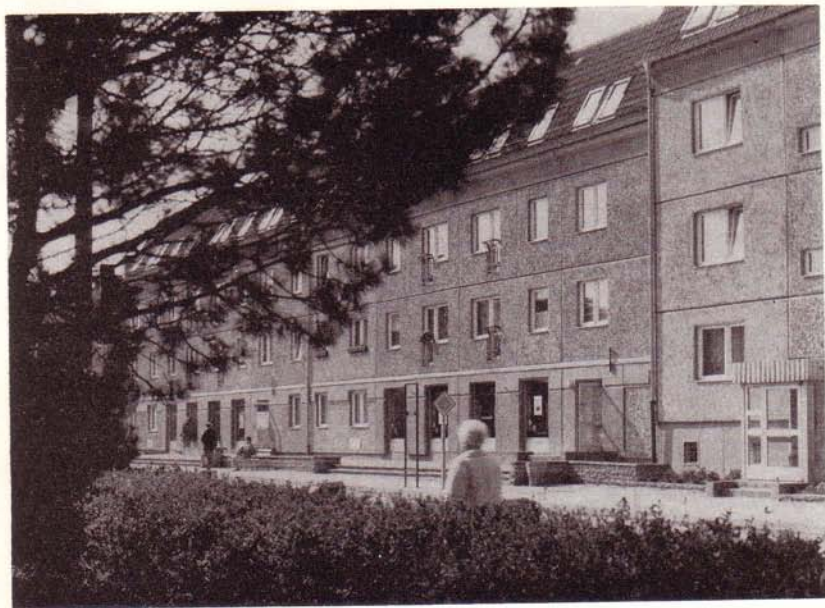
Moderne Wohnbauten am Markt in Woldegk mit Funktionsunterlagerungen, übergeben 1985