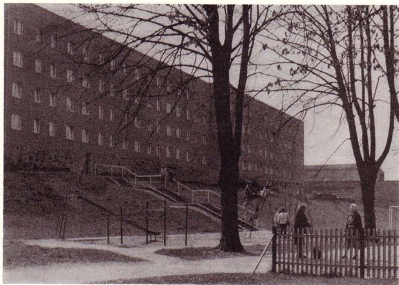
Neubauten der Pfarrstraße vom Wall aus gesehen. 1982 übergeben.