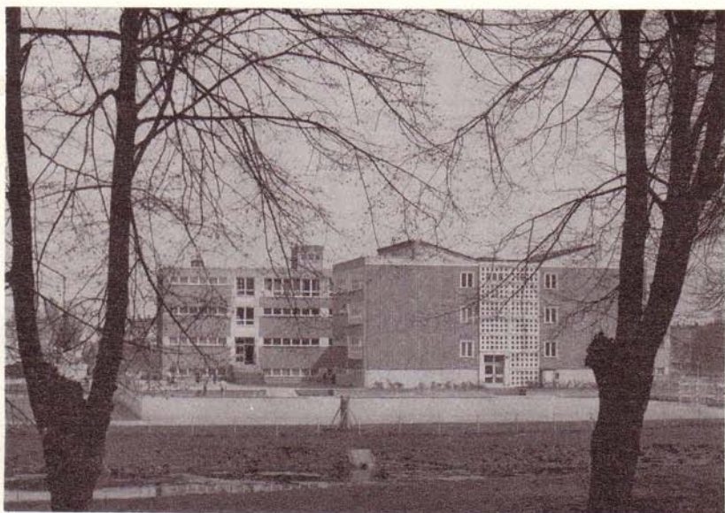
Wilhelm-Pieck-Oberschule in Strasburg, übergeben 1975

Im August 1949 erfolgte durch den damaligen Ministerpräsidenten des Landes Mecklenburg, Wilhelm Höcker, in Woldegk die Grundsteinlegung zum ersten Schulneubau auf dem Gebiet unseres heutigen Kreises. Seit dieser Zeit entstanden 19 weitere neue Schulen und seit dem VIII. Parteitag 7 neue Sporthallen.