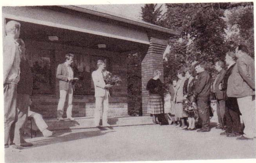
Übergabe der neugebauten Konsumverkaufsstelle WtB 1988 in Wolfshagen